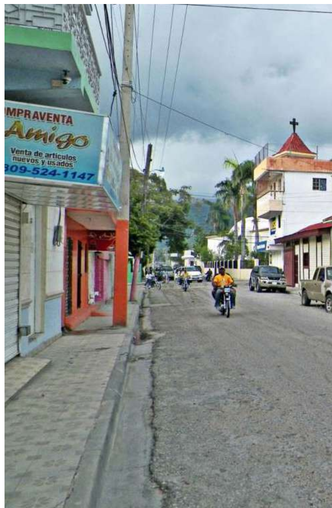
Paraíso de Dios. República Dominicana.

El corazón trasplantado comienza a tener casi vida propia, haciendo que el ejecutivo comience a sentir, a pensar, a desear y comportarse como su dueña. Y en esa contradicción que parece al principio muy sabrosa, pues el ejecutivo parece dueño de todo este cambio y disfruta de esa nueva vida donde parece que se siente cómodo; sin embargo, esta comodidad le lleva a cometer un error y cuando se produce el quiebre, todo se viene abajo y el corazón y la prostituta comienzan a emerger con todo su poder hasta hacerse dueños del cuerpo y de la mente de este pobre tipo